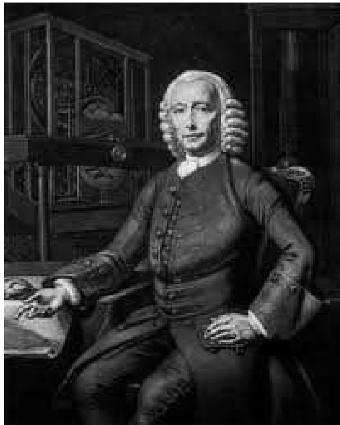
Fig.1. Portrait gravé de John Harrison d'après Thomas King

Le premier chronomètre véritable fut le résultat des efforts acharnés d'un seul homme, John Harrison (1693-1776) qui, après 31 années d'essais et d'erreurs, révolutionna l'art de la navigation maritime (fig.1) ; son invention permit d'améliorer la précision des approches et de diminuer sensiblement les risques d'échouage (fig.2).