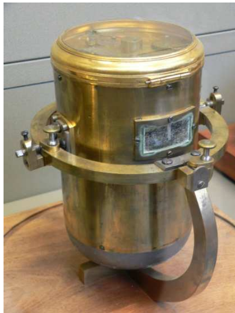
Fig.4. Ferdinand Berthoud, Chronomètre N° 24, 1782

À peu près en même temps, en France, Pierre Le Roy (1717-1785) inventa en 1748 l'échappement à détente caractéristique des chronomètres modernes. En 1766, il créa un chronomètre comportant un échappement à détente, un balancier à compensation de température et un ressort isochrone : Harrison avait montré la possibilité d'un chronomètre fiable en mer, mais les innovations de Le Roy furent considérées comme fondamentales pour les chronomètres modernes, rendant ces appareils beaucoup plus précis que ce qui avait été anticipé (fig.3).