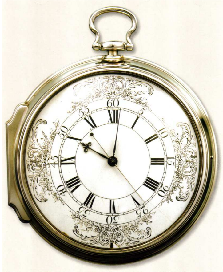
Fig.2. La "Montre de Marine" réalisée par John Harrison en 1761

Le chronomètre de marine, appelé aussi montre de marine, est une horloge suffisamment précise pour être utilisée comme une base de temps portable, y compris sur un véhicule en mouvement. Un chronomètre précis indique l'heure sur laquelle il a été calibré (le temps moyen de Greenwich (GMT), par exemple), même après plusieurs jours de voyage. Connaître l'heure (solaire) de Greenwich permet ainsi aux marins de calculer la différence de longitude entre la position de leur bateau et le méridien de Greenwich, puisque la Terre tourne de 15^\circ de longitude par heure.