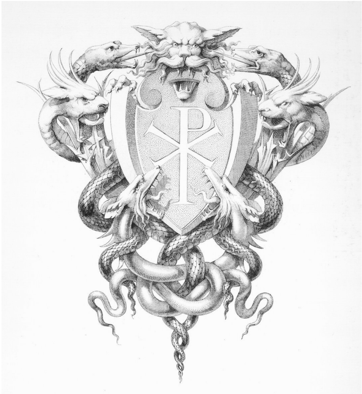
Fig. 2. Charles Rossignaux, Het Evangelie volgens de Heilige Lucas, Hoofdstuk 8 , gesigneerd en gedateerd 1869

Sierletters en ornamenten voor De Evangeliën , gepubliceerd door Hachette, 1873