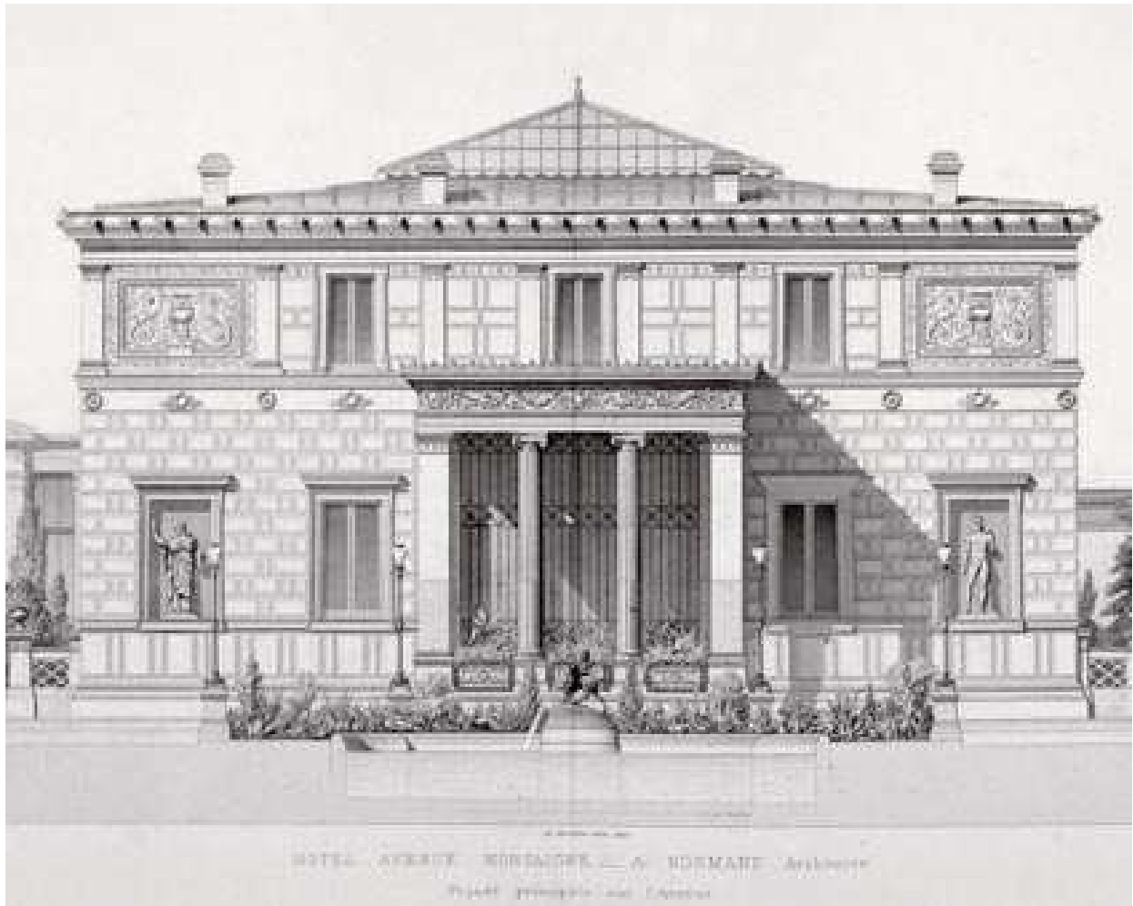
Fig. 4. Het Pompeiaanse huis aan de avenue Montaigne