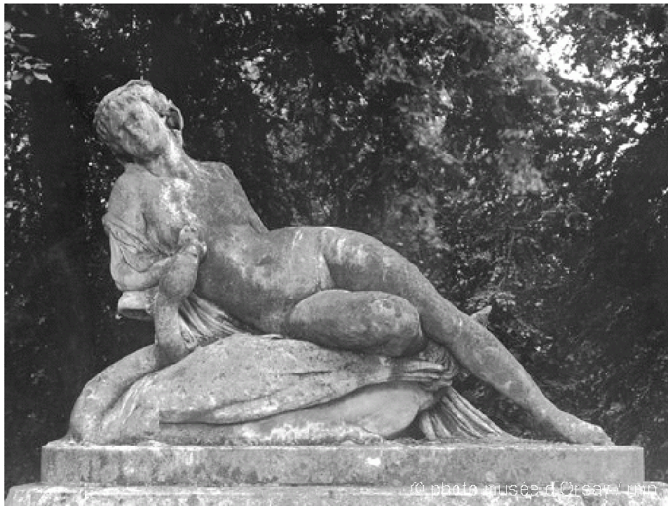
Leda die de strelingen van de zwaan wegduwt Compiègne, musée national du Château