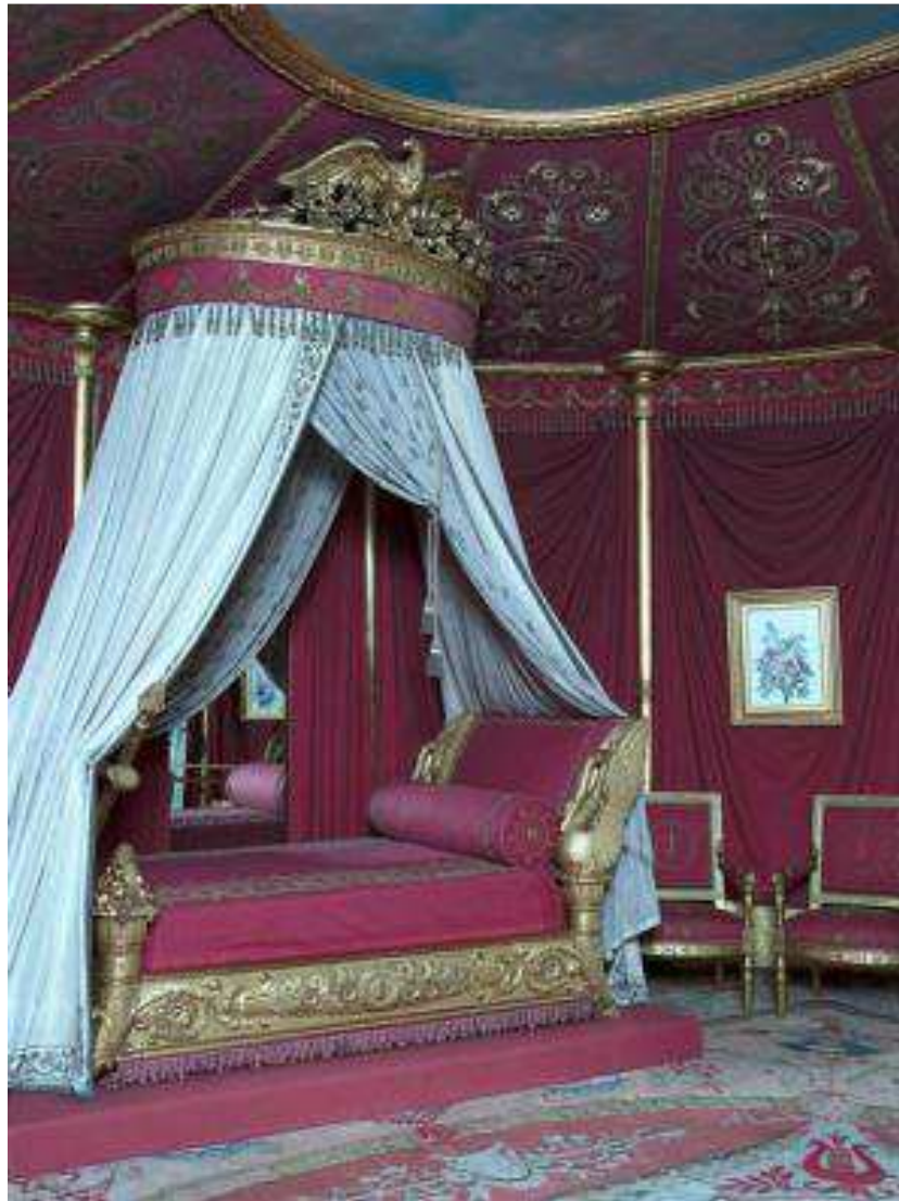
Fig. 1 Le lit de l'Impératrice Rueil-Malmaison, châteaux de Malmaison et Bois-Préau

Dès 1798, la forme et la souplesse du cou de l'oiseau fut mis à la mode par l'architecte Louis-Martin Berthault (1770-1823) qui l'utilisa pour le décor du lit de Mme Récamier, mais aussi pour le décor du lit de la grande chambre à coucher de l'impératrice Joséphine à la Malmaison, réalisé par Jacob-Desmalter (fig.1).