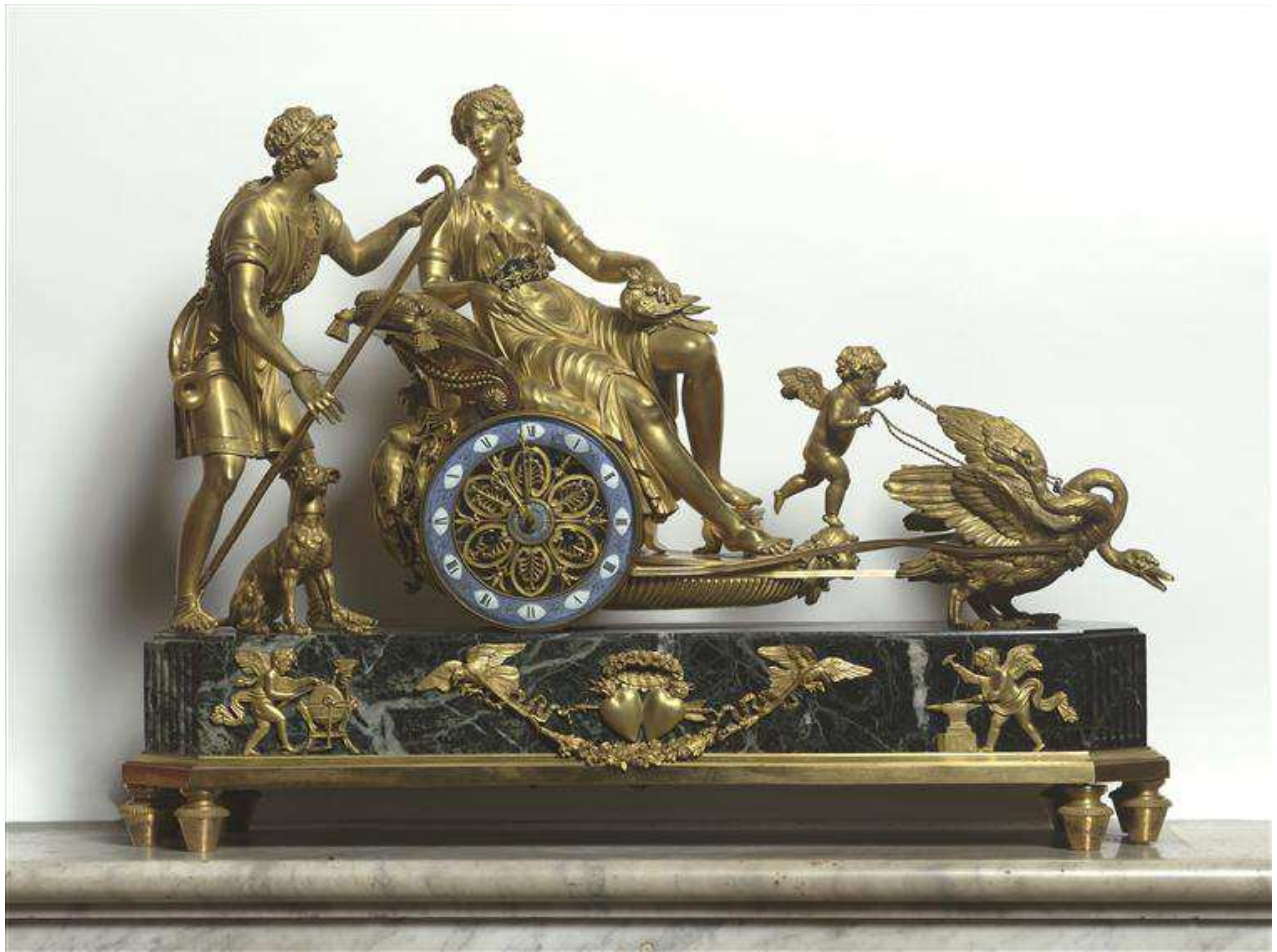
Fig. 2. Pendule : Le char de Vénus Rueil-Malmaison, châteaux de Malmaison et Bois-Préau N° d'inv. MM.40.47.7209