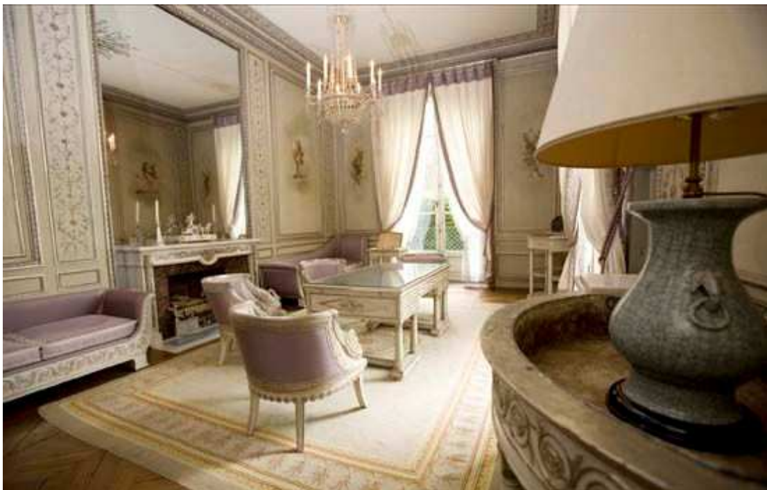
Fig. 4 Het zilveren boudoir van het paleis van de Elysée