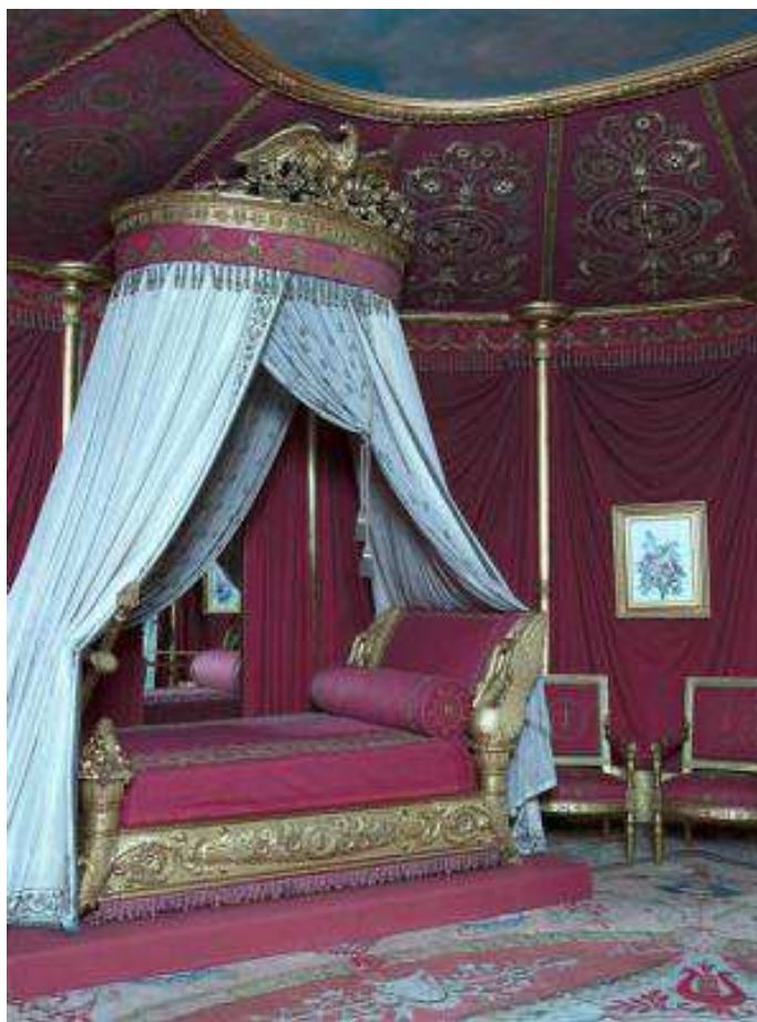
Fig. 1 Het bed van de Keizerin Rueil-Malmaison, kastelen van Malmaison en Bois-Préau