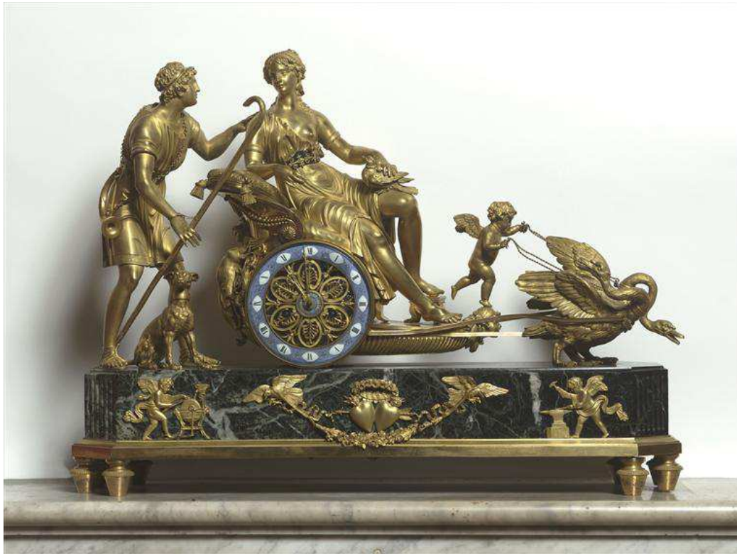
Fig. 2. Klok : De Wagen van Venus Rueil-Malmaison, Kastelen van Malmaison en Bois-Préau Inv. no. MM.40.47.7209