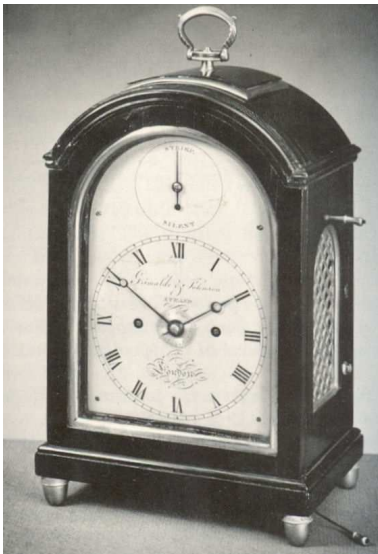
Grimalde & Johnson omstreeks 1820