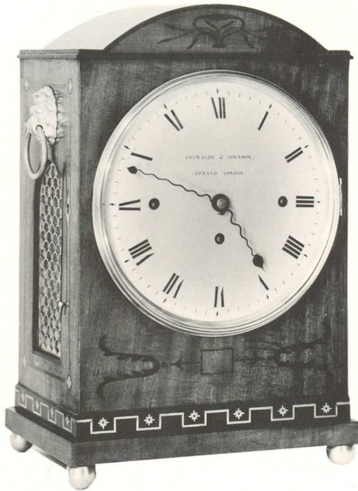
Grimalde & Johnson H: 42cm omstreeks 1825