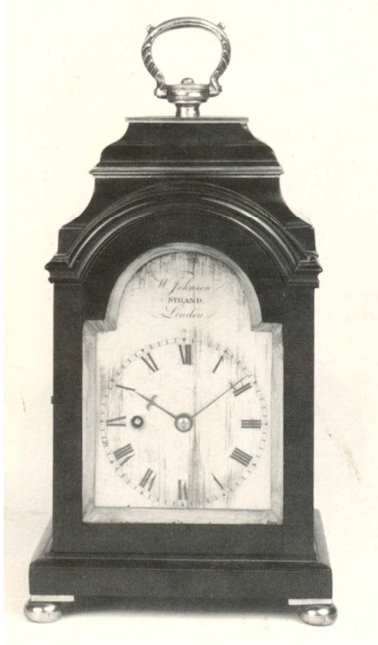
W. Johnson H: 23,5cm omstreeks 1830