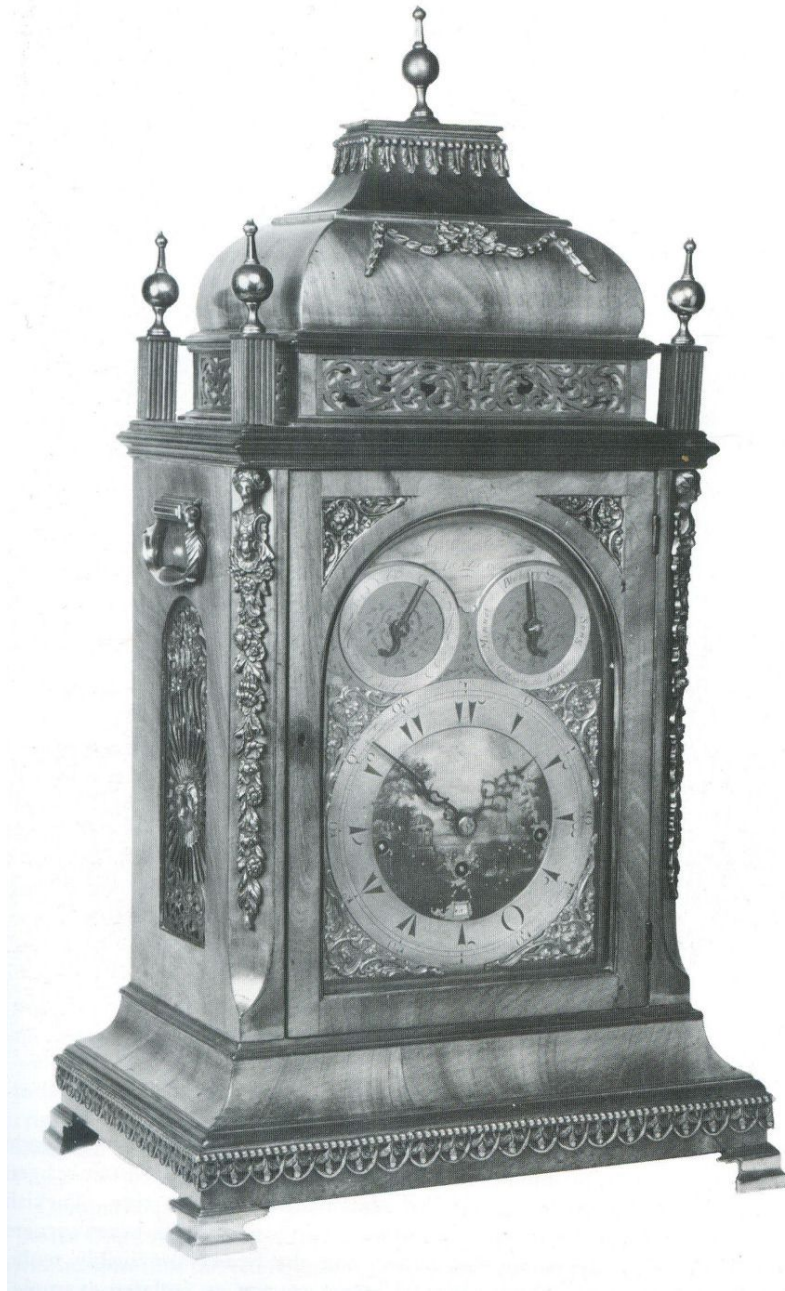
3. Muzikale klok in mahoniefineer voor de Ottomaanse markt, het midden van de wijzerplaat is geschilderd en de bovenkant van de klok versierd in Oosterse stijl.