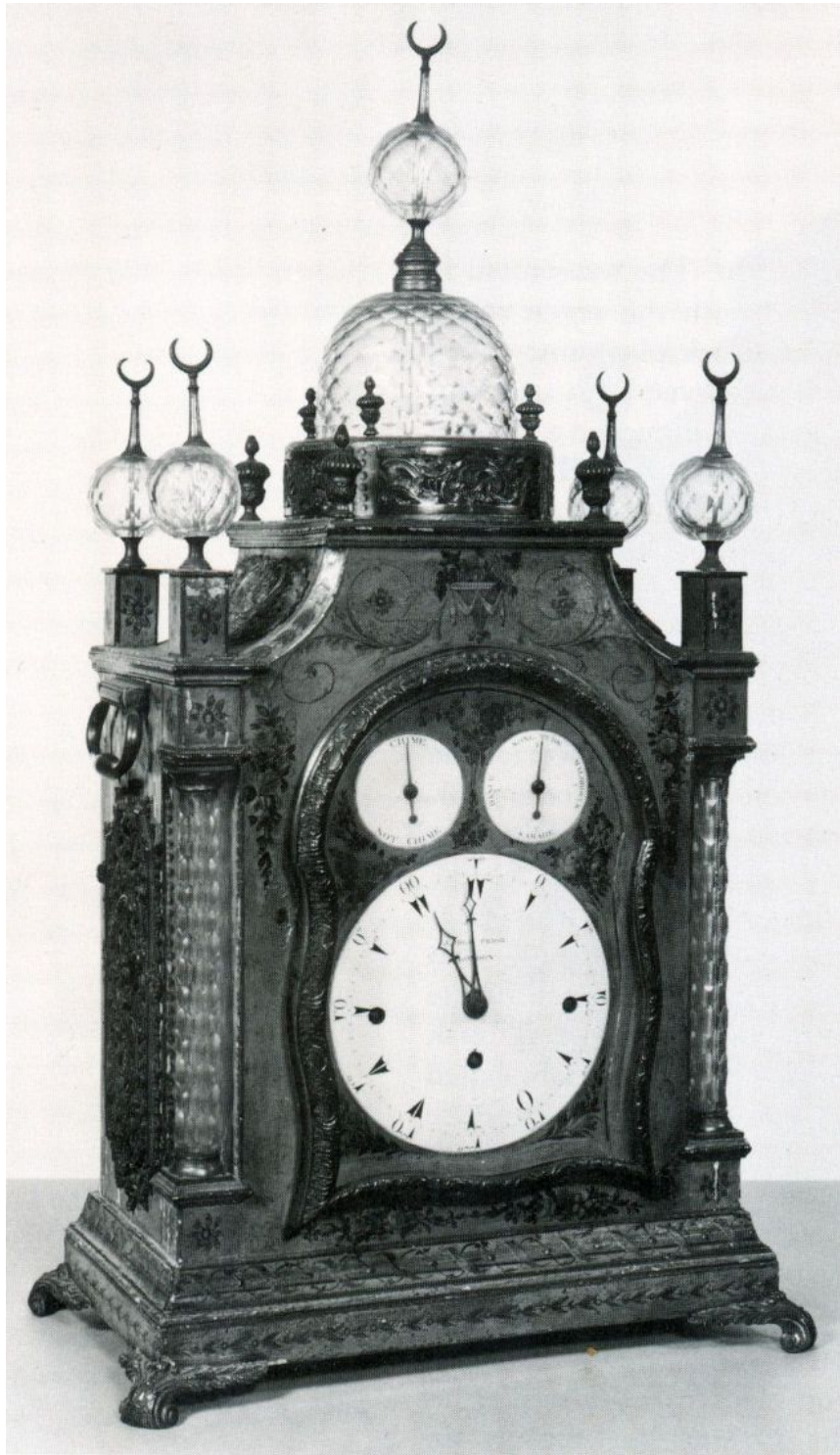
4. Muzikale klok voor de Ottomaanse markt in vernis martin, het bord van de wijzerplaat is ook geschilderd, de decoratieve bollen en koepel in bewerkt glas, de wijzerplaten in email, omstreeks 1785.