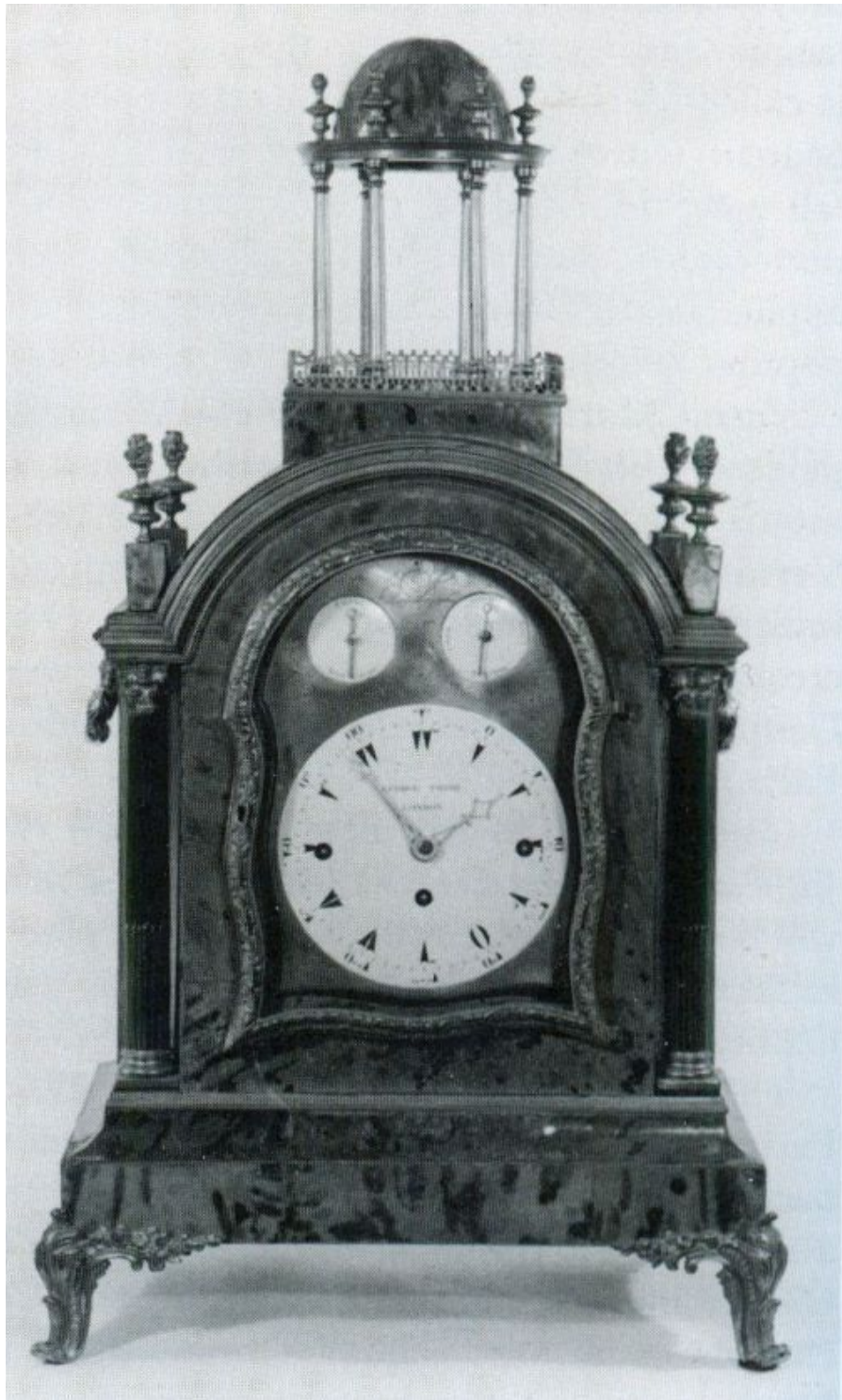
5. Muzikale klok voor de Ottomaanse markt in schildpadfineer, voormalig met een automaton onder de koepel.