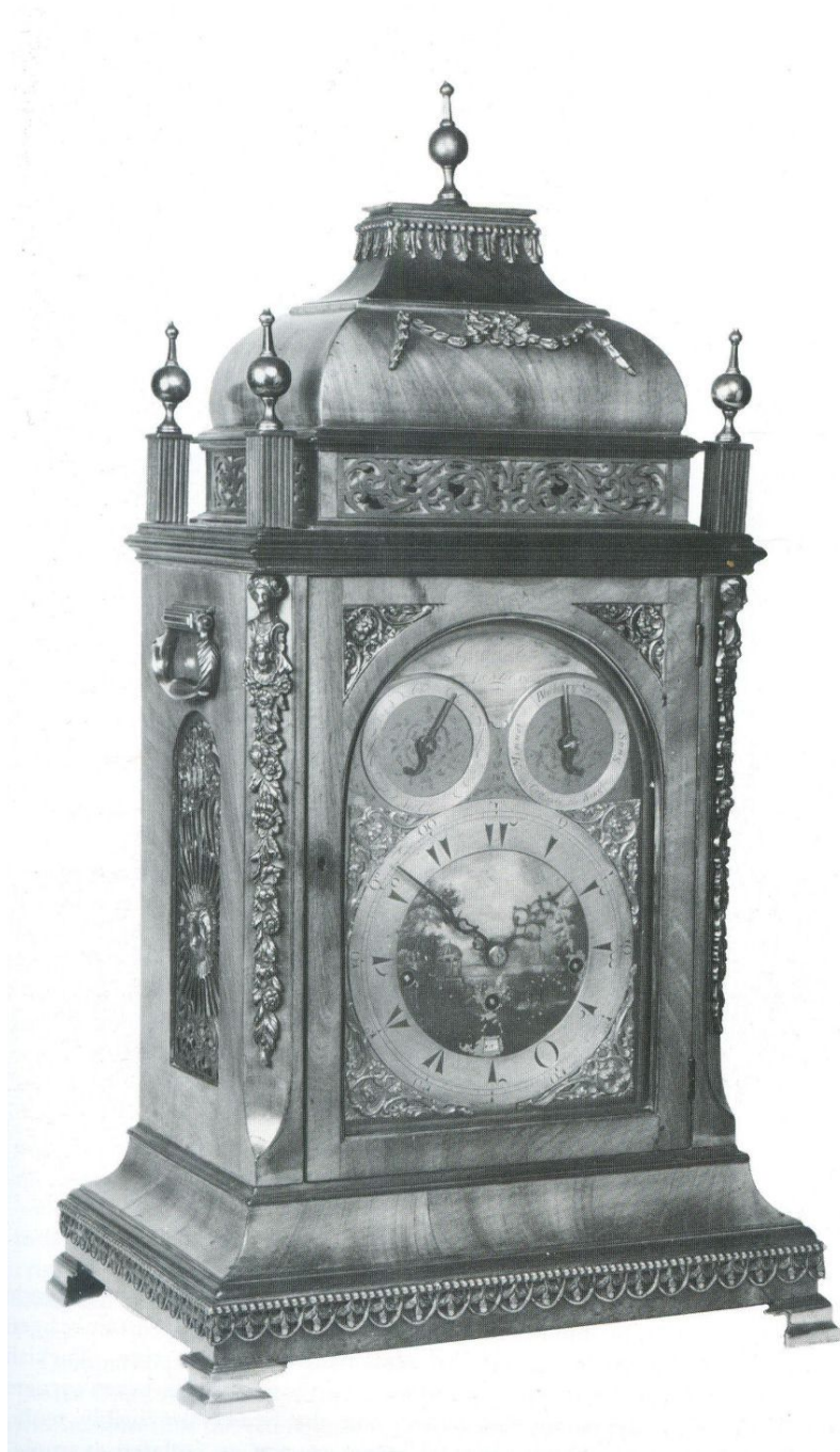
3. Pendule musicale en placage d'acajou pour le marché ottoman, le centre du cadran peint et le dessus de la pendule décoré à l'orientale.