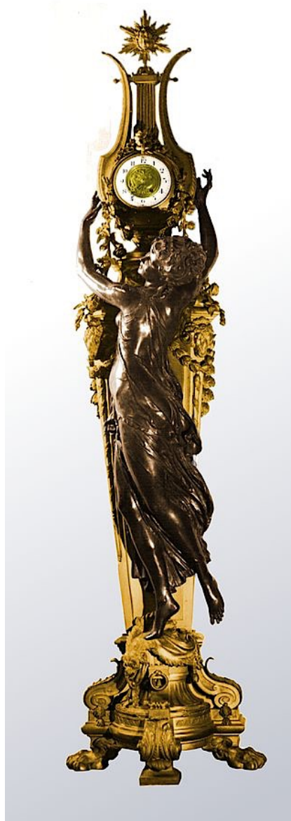
Fig. 1. Grande Horloge néo-Louis XVI, exécutée par la maison Lemerle-Charpentier Musée d'Art et d'Histoire de Troyes (N° inv. 894.15.19).