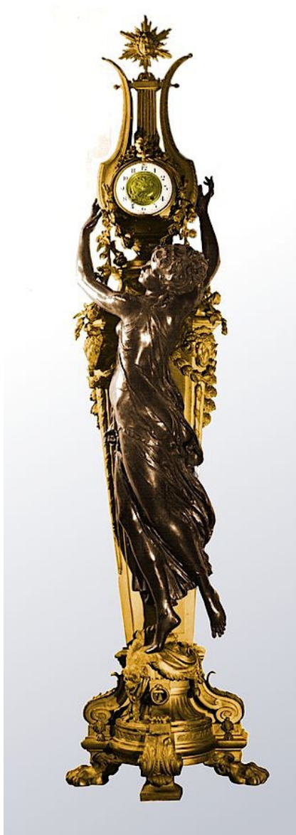
Fig. 1. Grote neo-Lodewijk XVI klok, vervaardigd door het huis Lemerle-Charpentier Musée d'Art et d'Histoire de Troyes (Inv. N°. 894.15.19).