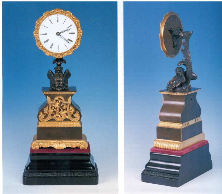
Fig.1. Robert-Houdin Eerste model van de mysterie klok

Volgens Derek Roberts 1 zou de eerste serie mysterie klokken van Robert Houdin verschenen zijn in de vorm van een wijzerplaat ondersteund door een griffoen op de romp van de klok die het mechanisme bevat, op een onbekende datum (fig. 1).