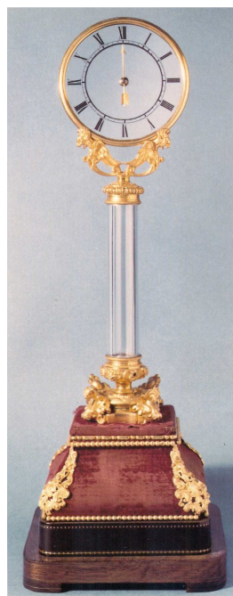
Fig. 3. Robert-Houdin Klok met twee mysteries