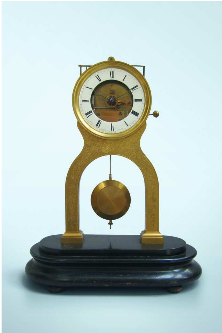
Fig. 8. Elektrische moederklok, gesigneerd Jean Robert-Houdin.

Aan deze ellenlange lijst kunnen we ook nog toevoegen dat Robert-Houdin één van de pioniers was voor de uitvinding van de elektrische klok. Hij deponeerde hiervoor in 1855 een brevet (fig. 8).