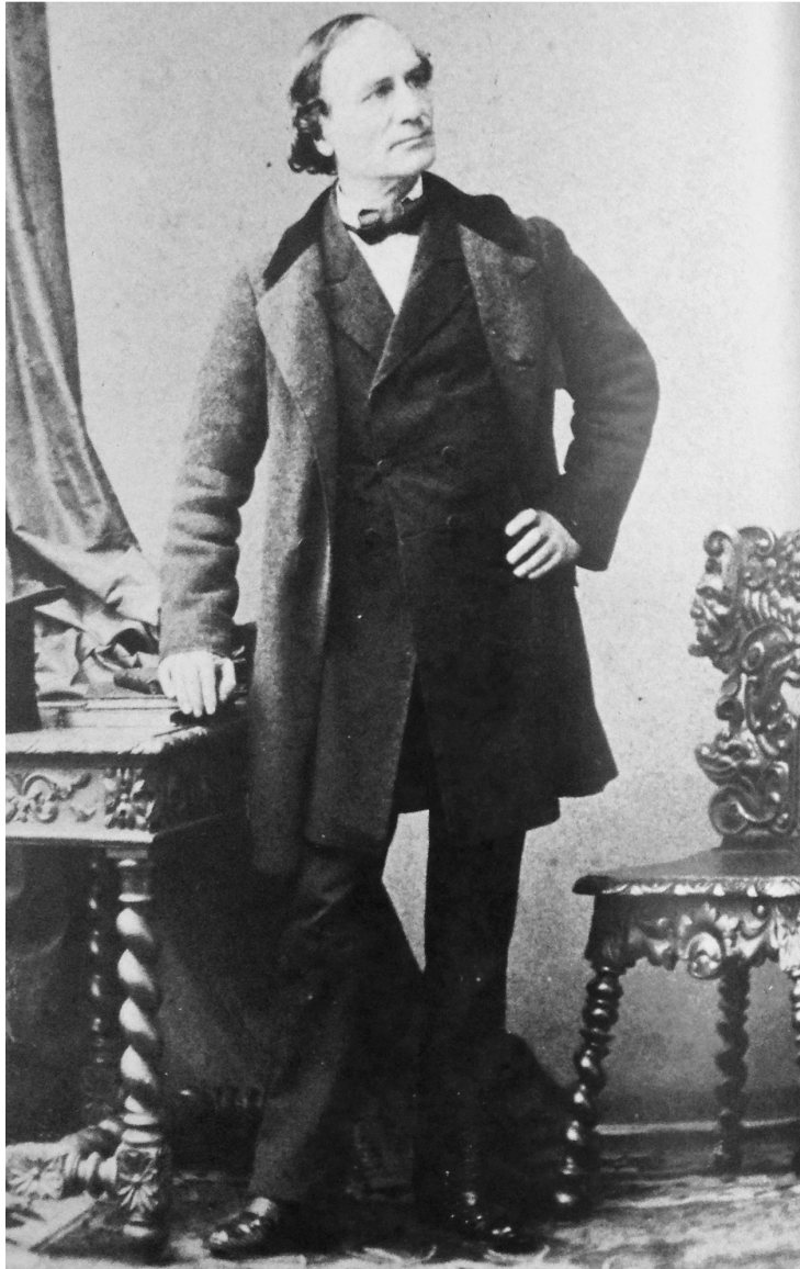
André Adolphe-Eugène Disdéri (1819-1889) Jean Eugène Robert-Houdin, 1855

« Je serai tenté de croire, écrit-il dans ses « Confidences », que je vins au monde avec une lime, un compas ou un marteau à la main car, dès ma plus tendre enfance, ces instruments furent mes hochets, mes joujoux ; j'appris à m'en servir comme les enfants apprennent à marcher et à parler ».