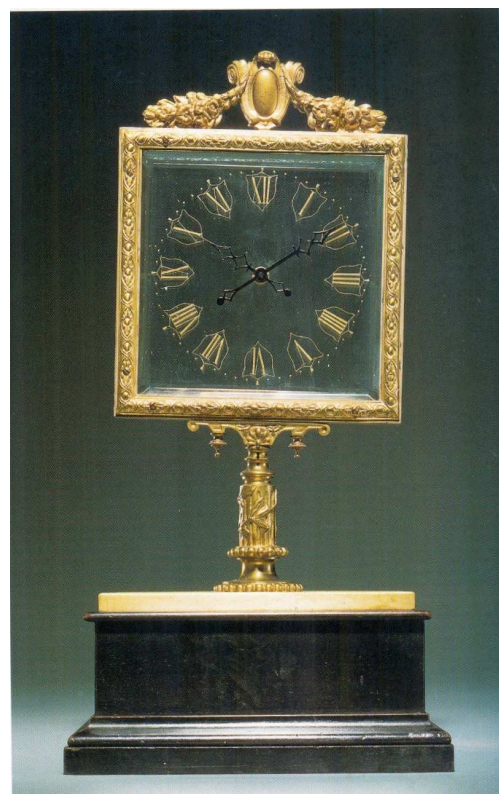
Fig.5. Robert-Houdin Mysterie klok, vierkante wijzerplaat