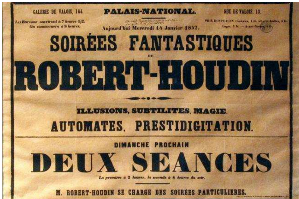
Affiche voor de Soirées fantastiques, Theater Robert-Houdin, 1852.