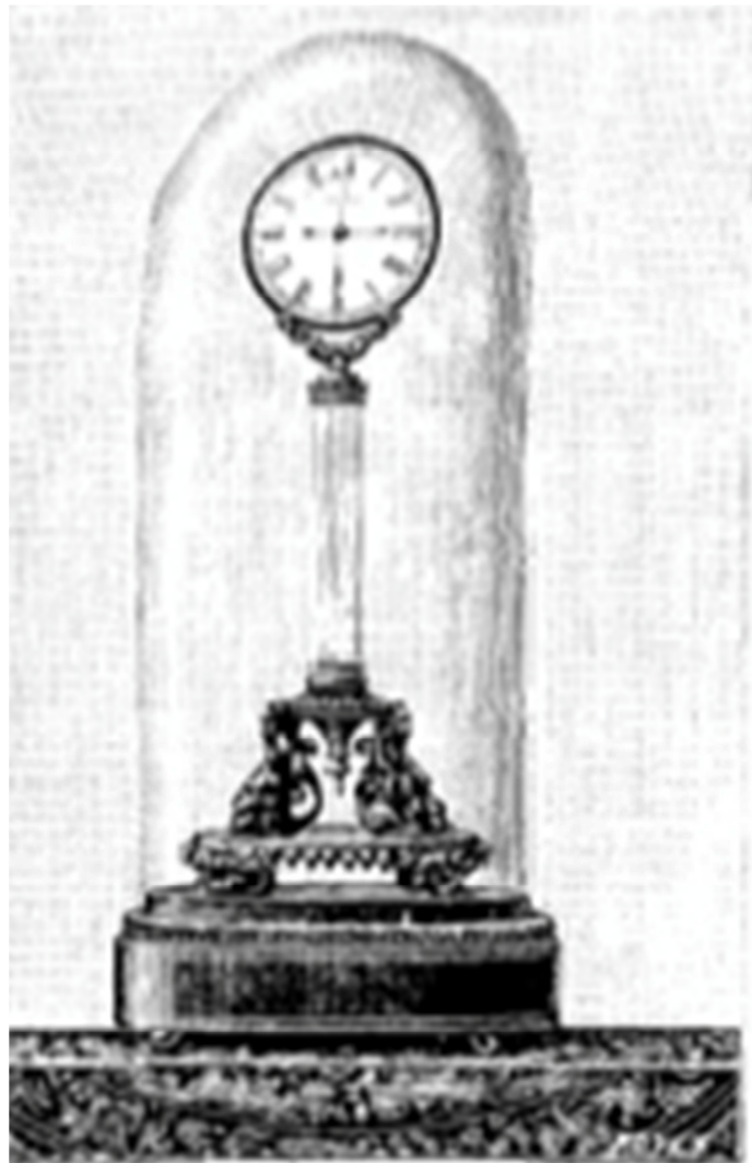
Fig. 6. Klok van Robert-Houdin, Wereldtentoonstelling van 1900

Het model van de mysterie-klok werd door Eugène Robert-Houdin voor de eerste keer tentoongesteld tijdens de Exposition des Produits de l'Industrie te Parijs in 1839. Hij exposeerde er zijn mysterie-klokken en een kleine automaat "Le joueur de gobelet", en ontving daarvoor de bronzen medaille.