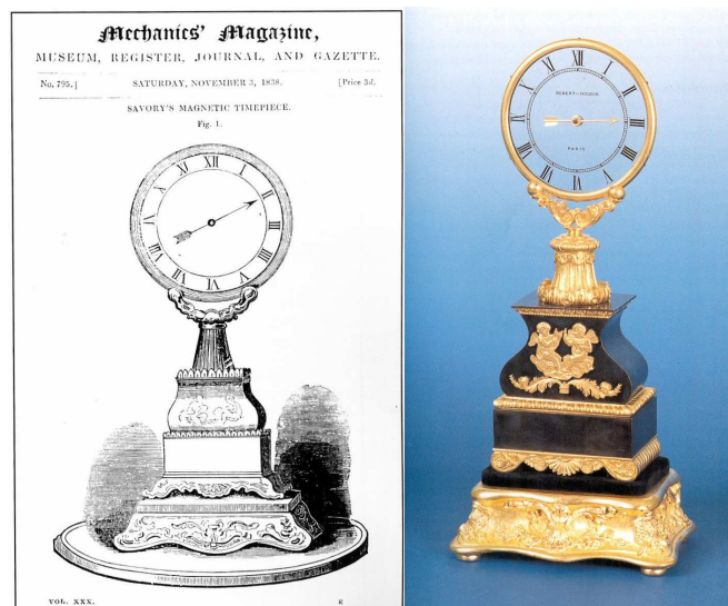
Fig. 2. Robert-Houdin « Savory's Magnetic Timepiece » en standaardmodel met één wijzer

Deze wordt vanaf 1838 opgevolgd door een tweede serie. Het model dat in de Mechanic's Magazine op 3 november 1838 getuigt hiervan. Het vermeldt de tentoonstelling ervan in de vitrine van de beroemde Londense zilversmid Mr. T. Cox Savory, nabij de Beurs (fig. 2). Vetrekkende van dit model zal Robert Houdin – in zijn zoektocht naar zowel mysterie als excellentie – een derde serie maken die bestaat uit een kristallen kolom die uit twee tubes gevormd is, en met één wijzer. Dit model wordt ook wel "klok met twee mysteries" genoemd (fig. 3).