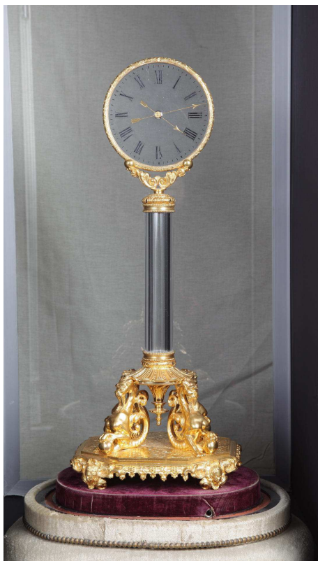
Fig. 4. Robert-Houdin Klok met drie mysteries (Blois, Maison de la magie, Robert-Houdin)

De vierde serie – waarvan onze klok "met drie mysteries" deel uitmaakt – loopt samen met de verschijning van een minutenwijzer en waarvan de centrale geminiaturiseerde timer verborgen is onder het midden van de wijzers. Dit model klok met drie mysteries is ook terug te vinden in het Musée de la Magie te Blois die aan Eugène Robert-Houdin gewijd is (fig. 4). Klokken uit de vijfde serie verschillen in het formaat van de wijzerplaat die niet meer rond is maar vierkant, om het mysterie nog complexer te maken. Zo gaat men tot vier lagen glas gebruiken om de mechanismen te verbergen, die – tot groot genoegen van de klokkenmaker-goochelaar – zijn tijdgenoten zal facineren (fig. 5). De zesde serie klokken behouden daarentegen dezelfde soort mechanisme; enkel de vorm van de wijzerplaat wordt ovaal of in een gebroken boog.